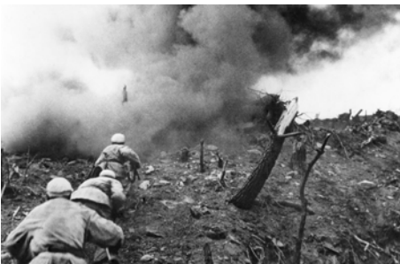
1952年，在上甘岭战役中，中国人民志愿军指战员在炮火支援下，攻上537.7高地北山