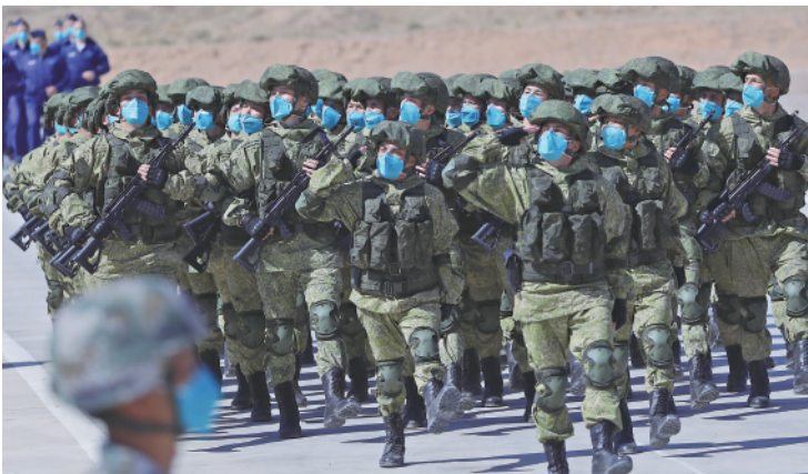
8 月 9 日在“西部·联合-2021”演习开始仪式分列式上拍摄的俄方陆军方队。

新华社银川 8 月 9 日电(记者刘芳)“西部·联合-2021”演习 9 日上午在宁夏某合同战术训练基地正式拉开帷幕。 中央军委委员、军委联合参谋部参谋长李作成担任演习总导演,出席演习开始仪式,并宣布演习开始命令。 巍巍贺兰,铁甲列阵。茫茫戈壁,塞上点兵。中俄两国国旗高高飘扬,中俄两军地面方队威严伫立。演习开始仪式上,两军参演官兵按作战编成编组 13 个地面方队、2 个空中梯队,接受沙场检阅。随后,