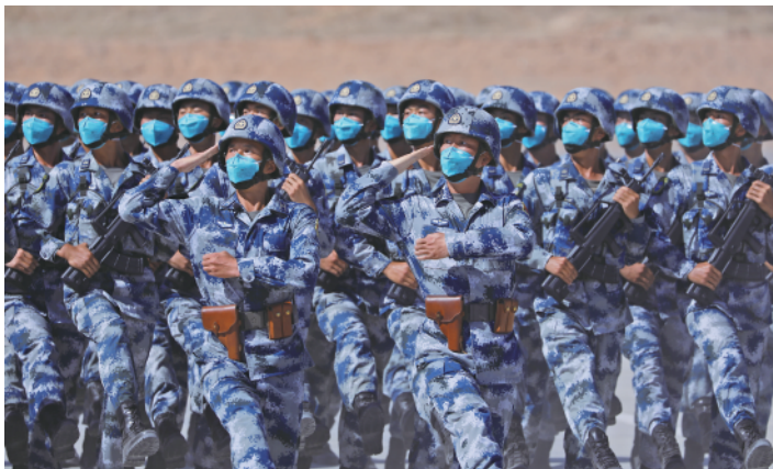
8 月 9 日在“西部·联合-2021”演习开始仪式分列式上拍摄的空军作战部队方队。