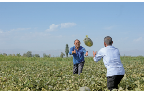
在新疆伽师县的瓜田里,瓜农在采摘伽师瓜(8月4日摄)。近日,“中国伽师瓜之乡”20余万亩伽师瓜成熟上市。