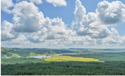
内蒙古鄂温克族自治旗境内的莫尔根林场森林、草原、湿地等自然景观丰富,夏季景色宜人。