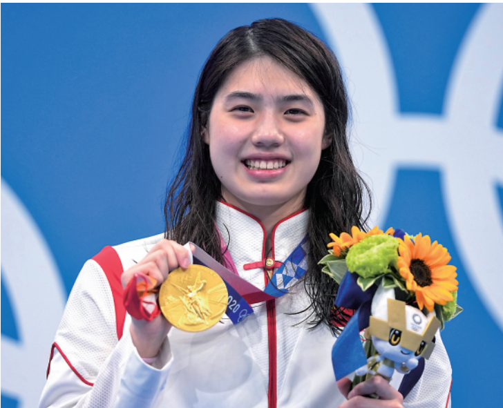
7 月 29 日,张雨霏在颁奖仪式上。