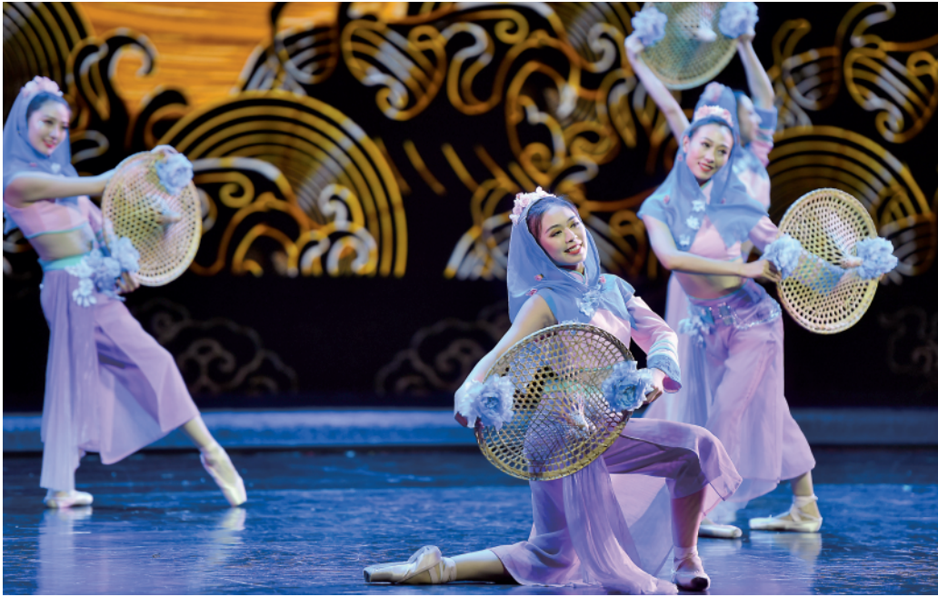
7月16日，演员参加开幕式文艺表演。当日，第44届世界遗产大会在福建省福州市开幕。

每当夜幕降临，泉州府文庙附近的金鱼巷口，“古城南音阁”的公益演出准时开场。一众围观者中，既有忠实“票友”，又有手捧奶茶的年