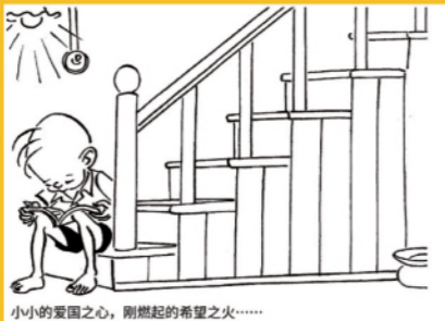
2、小小的爱国之心，刚刚燃起的希望之火……