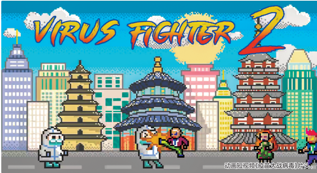
动画短视频《疫苗大战病毒》片头。

“我们能不能制作一款融媒产品，向世界展示中国通过积极号召注射疫苗抗击新冠疫情的经验，同时要对付