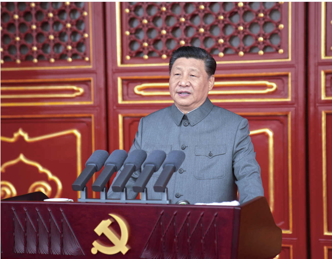
7月1日，庆祝中国共产党成立100周年大会在北京天安门广场隆重举行。中共中央总书记、国家主席、中央军委主席习近平发表重要讲话。

中华民族拥有在5000多年历史演进中形成的灿烂文明，中国共产党拥有百年奋斗实践和70多年执政兴国经验，我们积极学习借鉴人类文明的一切有益成果，欢迎一切有益的建议和善意的批评，但我们绝不接受“教师爷”般颐指气使的说教！中国共产党和中国人民将在自己选择的道路上昂首阔步走下去，把中国发展进步的命运牢牢掌握在自己手中！