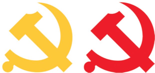
党徽图案标准版色度值：黄色 R=253 G=207 B=48 红色 R=237 G=44 B=37