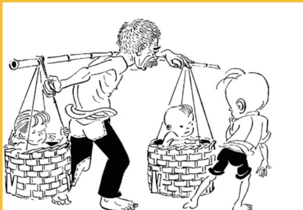
1、积贫积弱的旧中国,苦难深重的人民流浪乞讨……