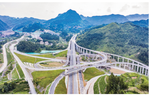
6月17日拍摄的贵州石玉高速公路花桥互通。近日,石阡至玉屏高速公路建设进入收尾阶段,预计今年7月通车。