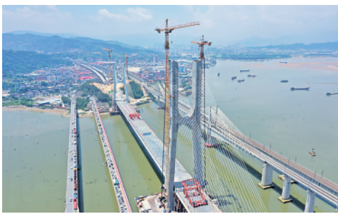
6月17日,新建福厦铁路乌龙江大桥举行合龙仪式,新建福厦铁路预计2022年具备开通运营条件。