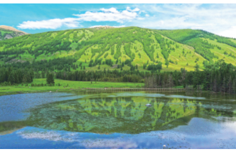
喀纳斯景区(6月10日摄)。近期,新疆阿勒泰地区喀纳斯景区旅游日渐升温。