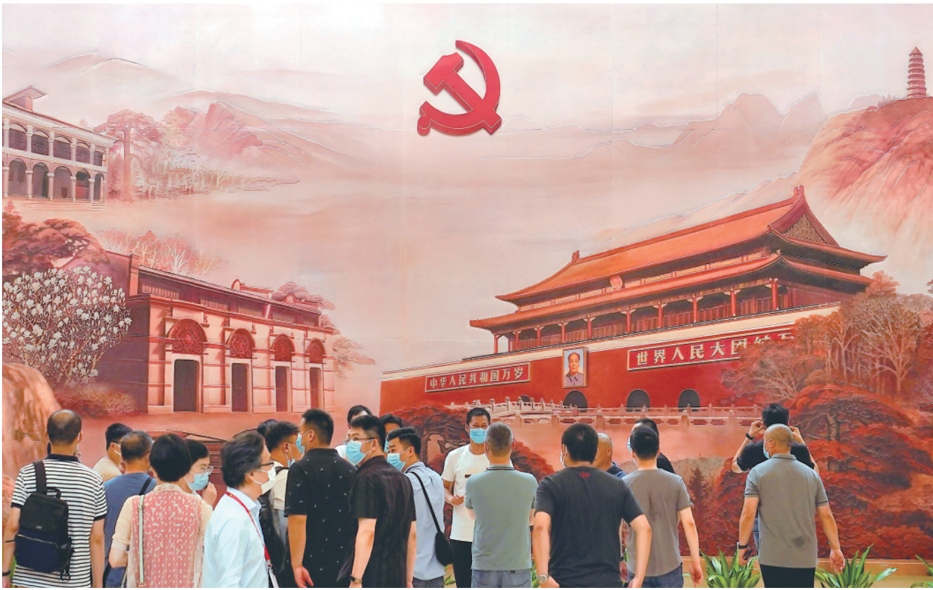
观众在中共一大纪念馆的“日出东方——从石库门到天安门”历史组画前参观(6月8日摄)。