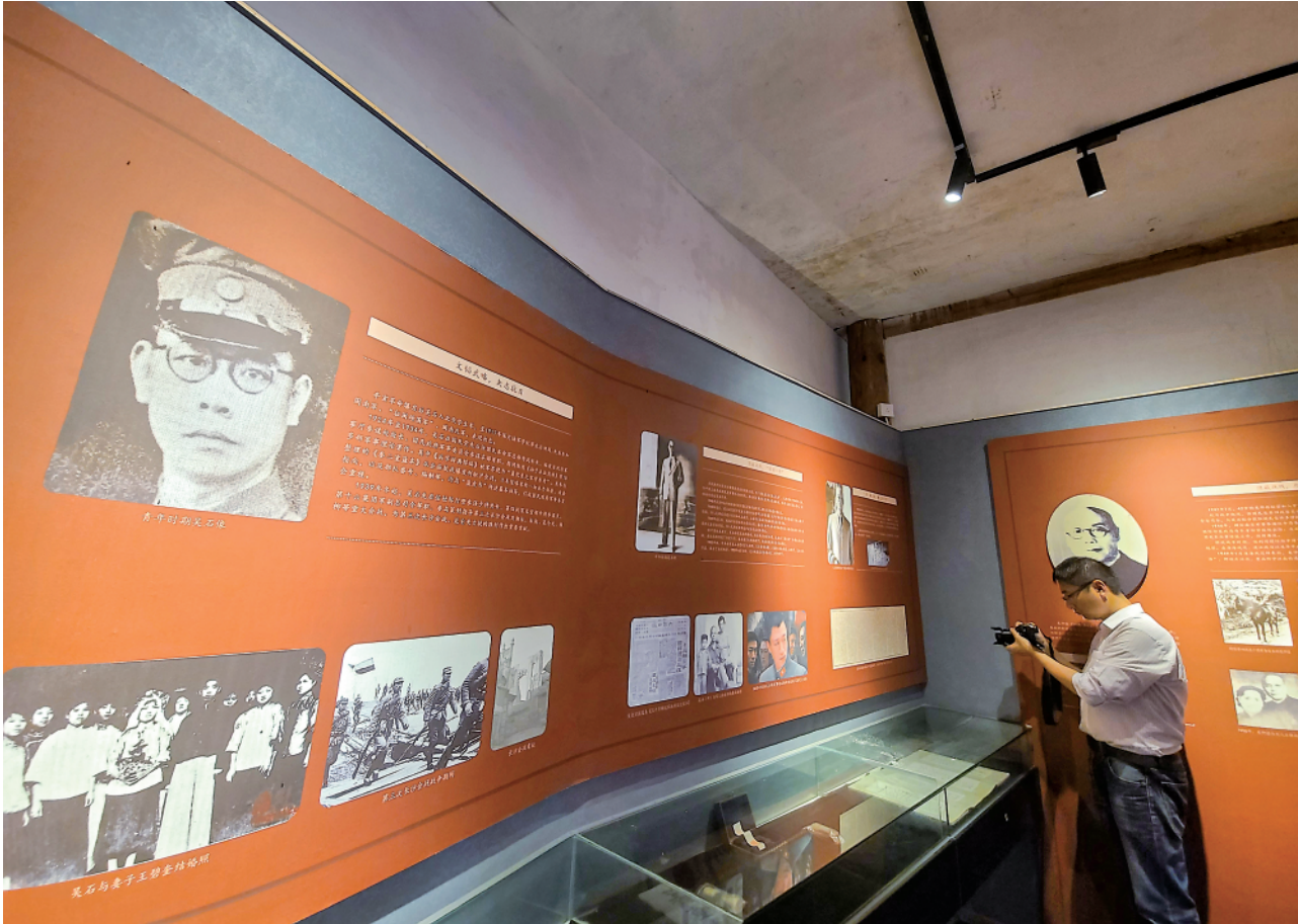
上图：游客在福州市螺洲镇陈氏五楼参观了解吴石事迹。