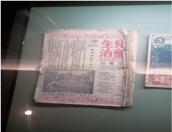
左图：淮安市新安旅行团历史纪念馆内展出的《儿童生活》（2021年3月10日摄）。