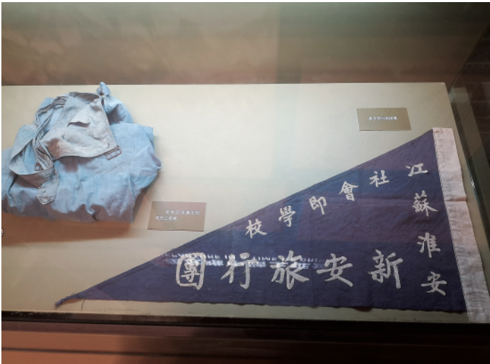
右图：淮安市新安旅行团历史纪念馆内的展品（2021年3月10日摄）。