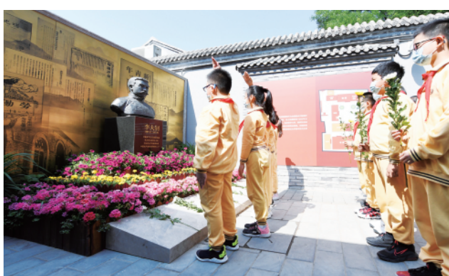
左图:这是6月1日拍摄的《新青年》编辑部旧址(陈独秀旧居)。新华社记者鞠焕宗摄 上图:同日,前来参观李大钊故居的学生为李大钊像献花。新华社记者张晨霖摄 下图:同日,一位参观者在《新青年》编辑部旧址(陈独秀旧居)观看展览。新华社记者鞠焕宗摄

人口全部脱贫,这是世界上绝无仅有的成就。 谈到未来中国经济的发展,鸠山由纪夫认为,中国今年设定了国内生产总值增长6%以上的预期目标,世界银行等机构也对今年中国经济增长预期普遍看好。在他看来,在目前全球新冠疫情尚未平息之时以及后疫情时代,中国将是全球经济复苏的重要推动力量。