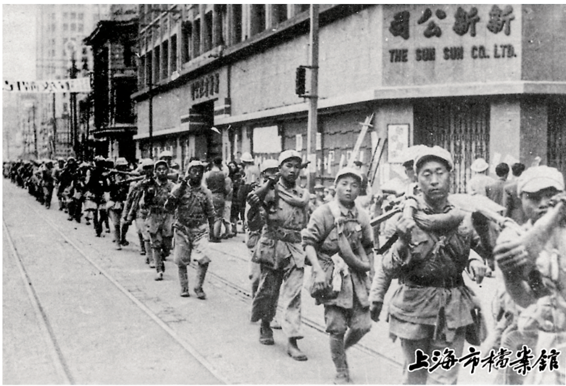
解放军行走在南京路上。