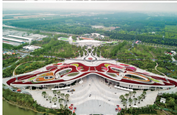
拼版照片:上图是渡江战役中解放军冒着敌人的炮火渡江;下图是2021年5月20日拍摄的位于上海崇明中国花卉博览会主场馆之一的世纪馆。