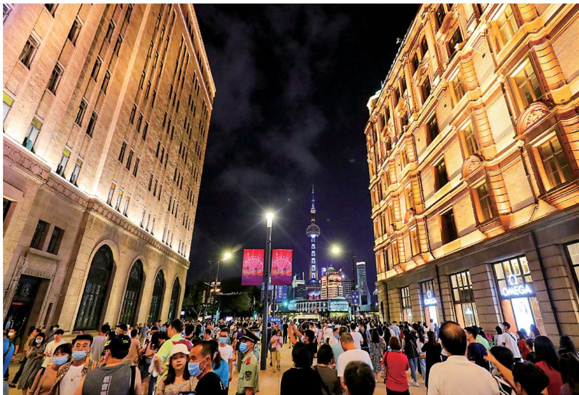
人们行走在南京路步行街东拓段的街道上(2020年9月12日)。