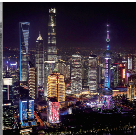
拼版照片:左图为解放军战士在浦东战场上对空射击;右图为浦东陆家嘴金融区夜景(2020年10月26日)。