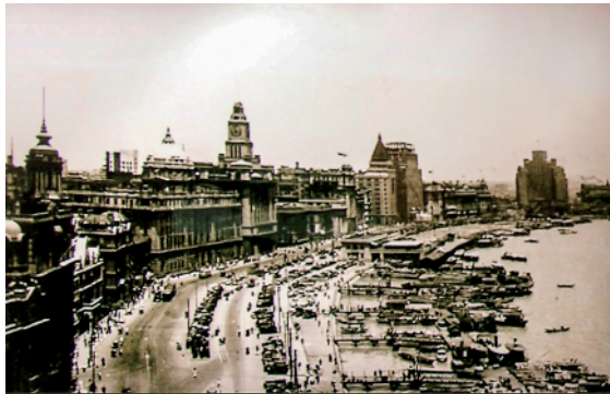
拼版照片:左图为解放前的上海外滩;右图为上海浦江两岸灯光璀璨(2019年9月18日)。