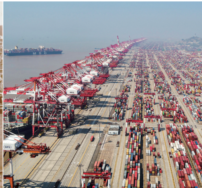
拼版照片:左图是解放前的上海烂泥渡货运码头(资料照片);右图是2020年3月18日拍摄的海上洋山港集装箱码头。