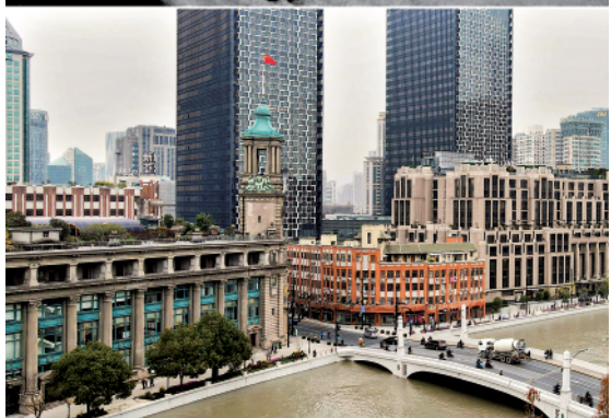
拼版照片:上图为解放军向上海邮政总局大楼里的残敌进攻;下图为2020年12月29日拍摄的海上邮政大楼。