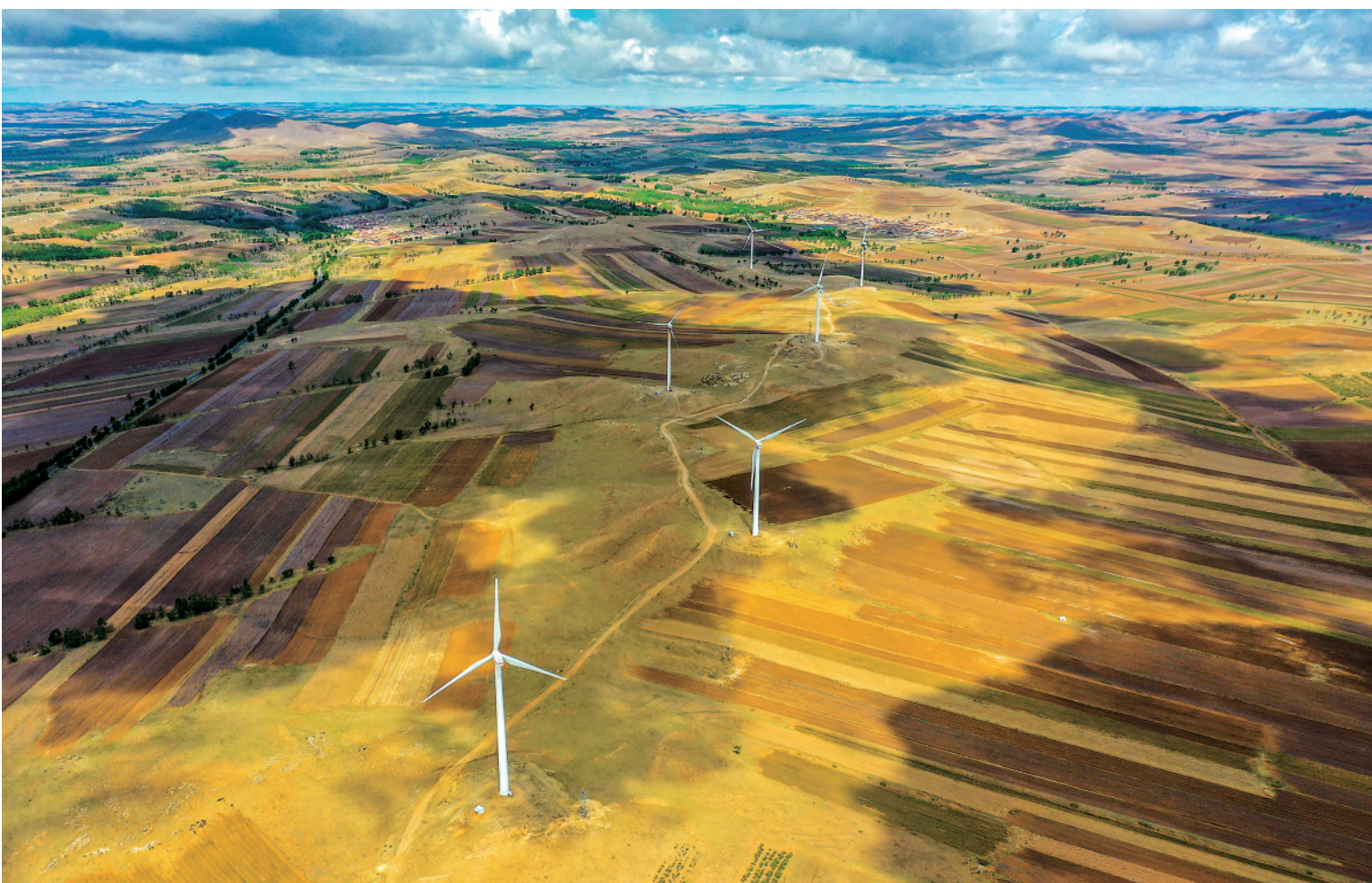
这是乌兰察布市商都县西井子镇风光(5 月 26 日摄,无人机照片)。 时下正值内蒙古自治区各地春播高峰期。在乌兰察布市商都县,当地农民抢抓农时,开展春耕春种,在塞上高原展开一幅美丽的春耕画卷。

悉,“文具盲盒”抽中所谓“隐藏款”的概率很低,反而让他们对“隐藏款”更为期待,很多孩子反复购买。除了文具店,记者在购物网站搜索发现,大量商家推出“文具盲盒”产品,价格从几元到上百元不等,其中一款“联名女生文具套装盲盒”月销量超过 5000 份。“铅笔、橡皮、尺子因为包装、图案不同成了孩子的收集物,我真的不能理解。为了凑一套图案,孩子买了好多笔了。”沈阳市民张女士告诉记者。