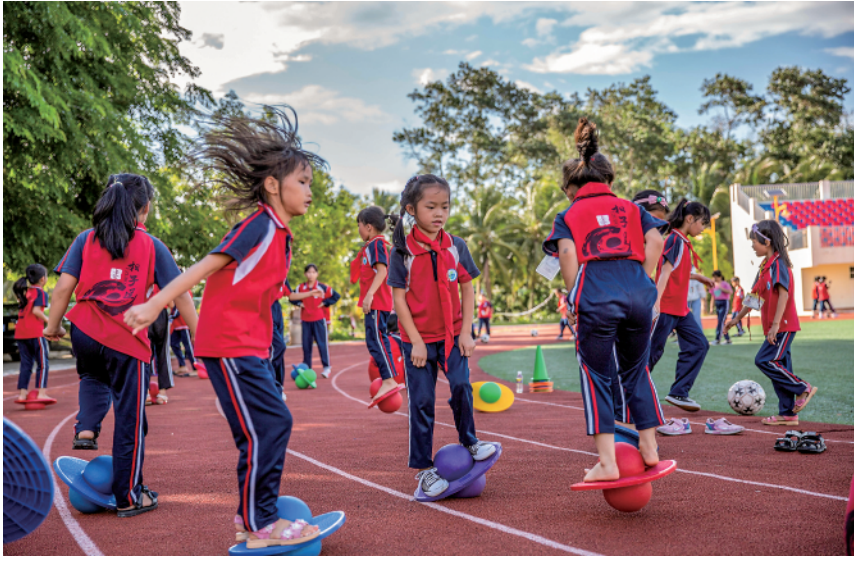
海南琼中黎族苗族自治县湾岭学校的学生在上选修课（2020年6月18日摄）。