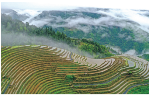
初夏时节，广西龙胜族自治县龙脊梯田景区内2000多亩梯田层层叠叠，美不胜收。

今日4版 总第10371期 / 国内统一连续出版物号CN 11-0209 邮发代号1-19 / 新华网:news.cn 新华每日电讯网:mr dx.cn