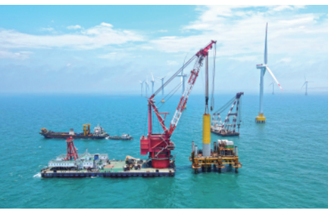
5月21日，一根直径6.7米的嵌岩单桩在福建省莆田南日岛西南侧海域成功植入海底。