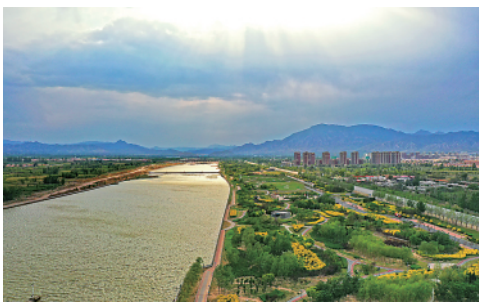
涿鹿县桑干河滨河公园(5月19日摄)。近年来,河北省张家口市涿鹿县持续推进桑干河及周边环境治理,取得良好成效。新华社记者牟宇摄

今日 12 版 总第 10368 期 / 国内统一连续出版物号 CN 11-0209 邮发代号 1-19 / 新华网:news.cn 新华每日电讯网:mr dx.cn