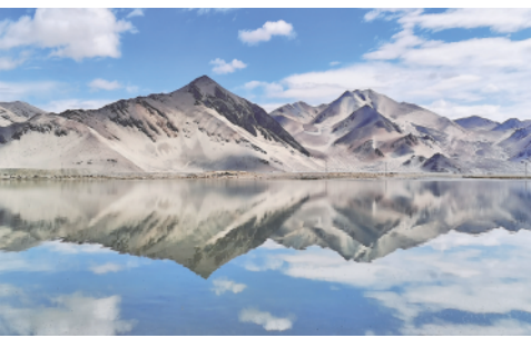
5月13日在西藏定结县拍摄的湿地风光(手机照片)。在喜马拉雅山北麓、雅鲁藏布江以南的狭长地带,分布有大面积的湿地。