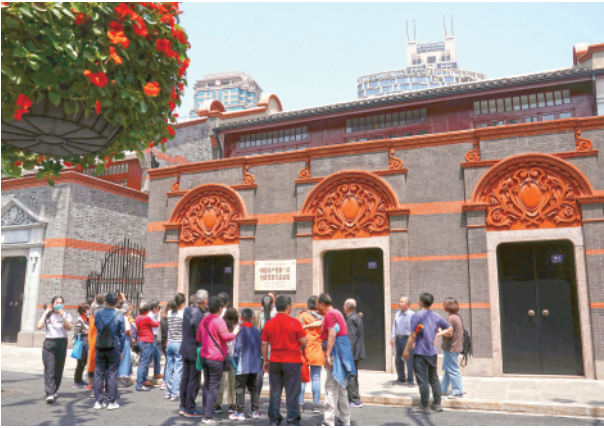
5月1日,游人在中共一大会址前留影。

1921年,这幢小楼里亮起煤油灯光,13位平均年龄28岁的年轻人,一番热烈讨论后,向四万万同胞发出惊雷般宣告:我们的名字叫中国共产党! 抚今追昔,初心未改。 距离这里仅一步之遥的旧改基地宝兴里,2020年底,居民们告别手拎马桶的“72家房客”生活,搬迁新居。“钻石”地段拆迁,各级党组织以脚力丈量,用“民生账”填平“市场账”,一点点敲开居民“心门”。仅仅354天,这一旧改最硬的骨头实现100%自主签约、100%自主搬迁,