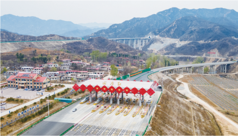
太行山高速公路城南庄出入口。