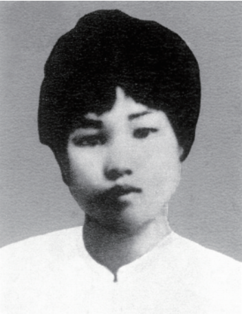
杨开慧像(资料照片)。