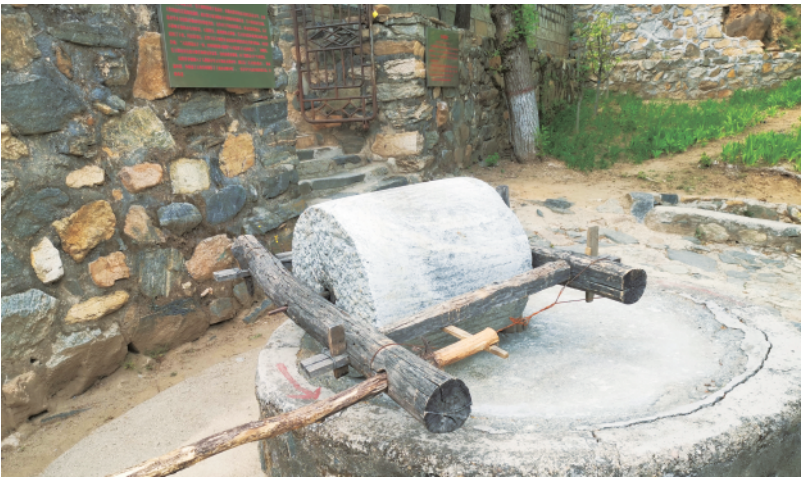
阜平县城南庄镇花山村毛主席旧居前的石碾。