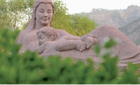
在兰州市七里河区拍摄的黄河母亲雕塑（5月8日摄）。1986年雕塑落成后，这里就成了兰州的“打卡地”。