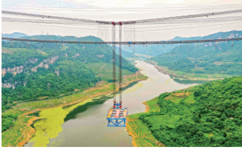
5月9日，贵州瓮（瓮安）开（开阳）高速开州湖特大桥首片重约250吨的钢桁梁吊装顺利完成。