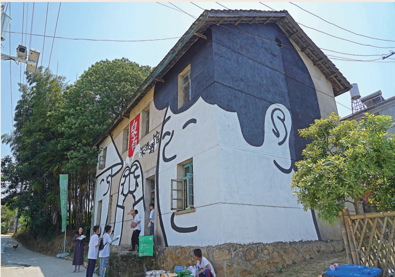
上图:参观者在浮梁县寒溪村参观艺术项目作品。

5月1日,“艺术在浮梁2021”艺术展在江西省浮梁县臧湾乡寒溪村开幕。此次展览项目采用“大地艺术”的形式,以寒溪村全村为展示区域,邀请日本、意大利、中国等5个国家的26位艺术家进行艺术创作,在假日期间打造一个“没有屋顶的乡村美术馆”,为艺术参与乡村振兴提供一条有价值的探索之路。