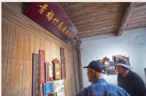
左下:参观者在寒溪村参观艺术作品《青梅竹马照相馆》。