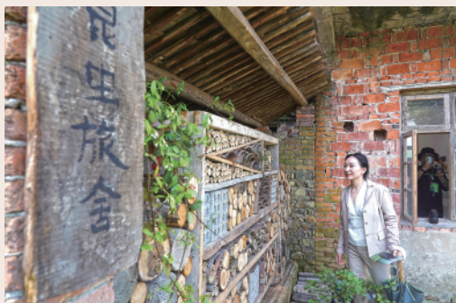
参观者在寒溪村参观艺术作品《昆虫旅舍》。