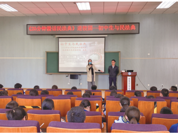
为宣传好民法典,新华出版社近日联合北京市丰台二中举办“初中生与民法典”讲座。图为主讲人、北京理工大学民法典研究中心主任孟强(右)与同学们交流。

云南省人社厅有关负责人说,云南还将试点在驻昆高校建设专业化职业指导队伍,充分发挥人力资源服务机构、行业协会等社会力量作用,拓展就业服务供给渠道,推出具有本地特色的网上职业指导公开课、直播课,扩大职业指导服务覆盖面,提升行动成效。