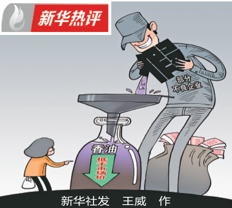
新华社发 王威 作

今年3月，本报记者在走访时发现，被中央环保督察组通报3年后，贵州台江经开区园区附近居民在家仍得戴N95口罩，果蔬水稻林木被“熏”坏，疑似大气污染现象不减反增。