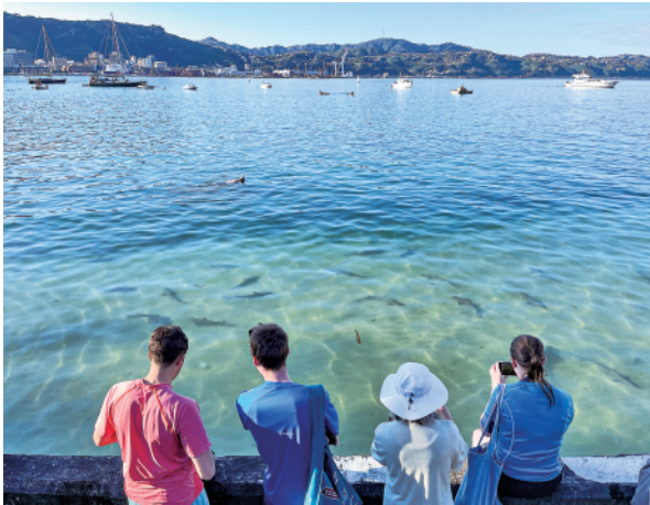
2021年1月14日，人们在新西兰惠灵顿东方湾海滩观看鲨鱼。

奥克兰大学海洋生物学教授马克·科斯特洛说，这项研究表明，气候变化已在全球范围影响海洋生物多样性。