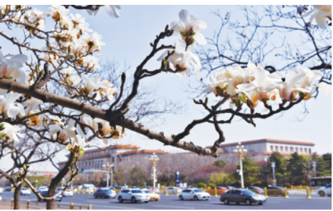
3月24日在北京人民大会堂附近拍摄的玉兰。随着气温回升，北京街头各种花卉竞相绽放，美不胜收。 新华社记者罗晓光摄