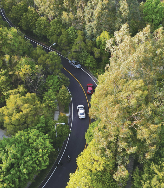
这是3月24日拍摄的福山郊野公园步道美景。该公园位于福州市鼓楼区西部、闽江东侧，面积约200公顷，步道总长约20公里，是福州市民欣赏绿水青山、呼吸新鲜空气、环看城市美景的好去处。