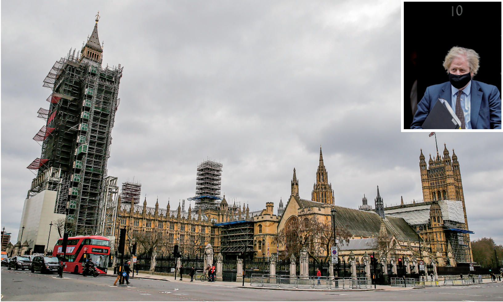
小图：3月16日，英国首相鲍里斯·约翰逊离开位于英国伦敦唐宁街10号的首相府准备前往议会，介绍“竞争时代的全球英国——安全、国防、发展与外交政策的整体评估”报告。