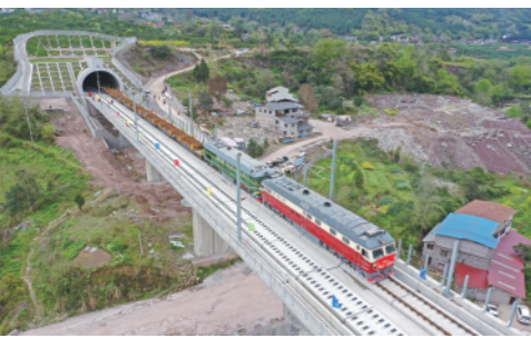
3月17日,“走单线铺双线”施工技术在郑万高铁重庆段正式投入运用,填补了我国相关铺轨作业技术空白。