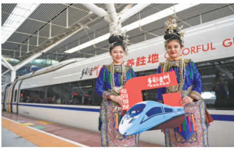
3月16日,来自贵州的少数民族演员在深圳北站的“赏花浪漫季—多彩贵州”冠名高铁动车组前留影。