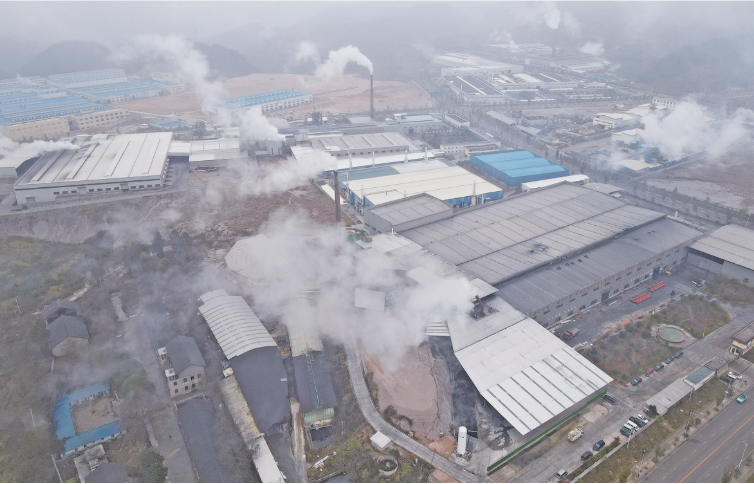
左大图：无人机拍摄的台江县经济开发区工业园区。右图上：台江县革一镇后哨村的部分蔬菜。右图中：工业园区附近村民使用过的口罩。右图下：后哨村周边的部分树木已经干枯死亡。

“前几年种枇杷是主要经济来源，工业园区开起来以后，我们的枇杷产量一年比一年少，枇杷果子个头越来越小，有的果子甚至长不大就