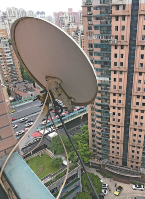
左图：上海一小区安装在高层住宅阳台外的“卫星锅”。右图：上海市黄浦区大同花园小区高空坠落的“卫星锅”。

上海市黄浦区房管局提供的报告显示，经对该区 180 栋建筑物（楼房）排查，发现各种隐患共计 1013 处，外墙墙面附着物隐患 568 处，占各种隐患总量的 56.07%，其中“卫星天线”高坠隐患共计 73 处，占外墙墙面附着物隐患的 12.58%，并占全部各类高空坠物隐患的 7.2%。记者在黄浦区多个街道辖区内发现，无论是