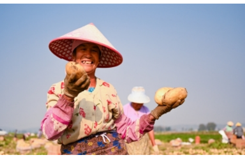
3月16日,农民展示收获的马铃薯。近日,云南德宏傣族景颇族自治州芒市风平镇迎来马铃薯收获季。