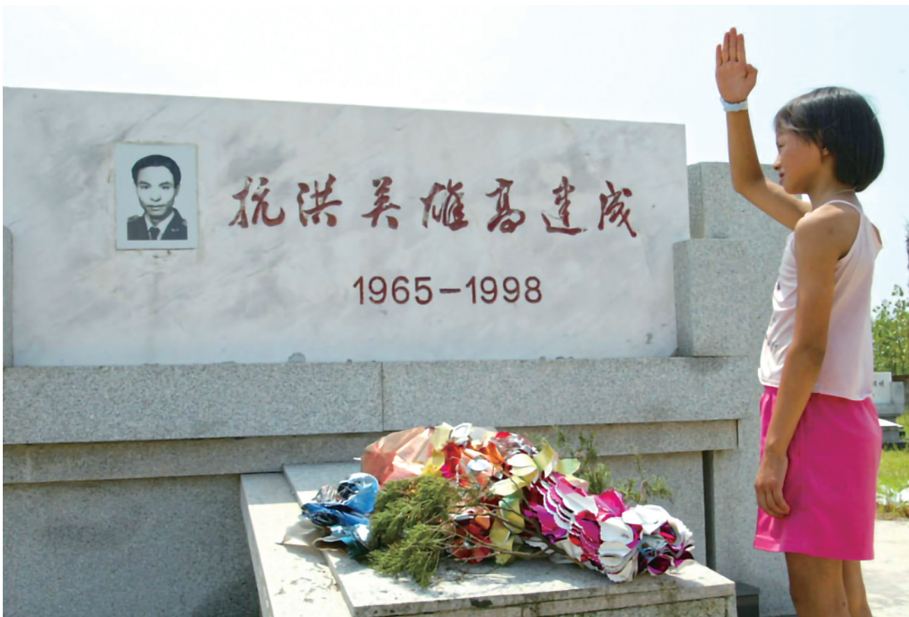
2002年8月29日，江珊向设立在湖北省嘉鱼县簰洲湾民垸中堡村村边的“抗洪英雄高建成”烈士墓致敬。