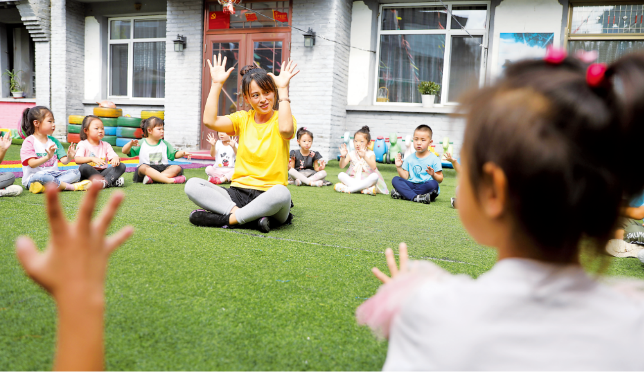
幼教老师在辽宁省凤城市大梨树村萌芽幼儿园里带领孩子们做游戏(2020 年 9 月 9 日摄)。