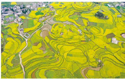
贵州省六盘水市六枝特区木岗镇的油菜花田(3月5日摄)。惊蛰过后,全国的春耕生产由南向北渐次展开。