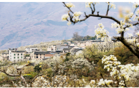
三月,有“花海果乡”之称的四川省汉源县九襄镇10万亩梨花竞相开放,流沙河两岸、山上山下一片雪白。