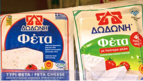
这是3月2日在希腊商店拍摄的不同品牌的菲达奶酪。