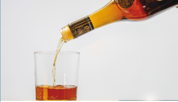
这是3月2日在西班牙马德里拍摄的雪莉白兰地。

中欧地理标志协定3月1日起生效。首批“上榜”的中欧各100个地理标志即日起受到保护，这意味着中国和欧盟的更多特色优质名品将进入彼此市场，不仅将更好保护中欧企业权益，也会让双方消费者买得放心。以下是中欧地理标志协定中首批受保护的部分欧盟地理标志产品。