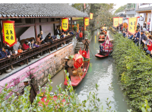
游客在湖州市南浔区和孚镇荻港村观看“水上晒秋”丰收庆典。（2020年11月15日报）