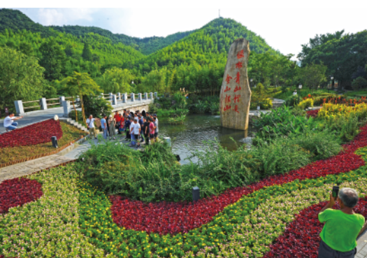
游客在浙江省湖州市安吉县余村游览（资料图）。

2018年3月初，吴兴区妙西镇的“原乡小镇”正式开园了。亚洲最大的蝴蝶生态科普馆、国内最长的赏梅木栈道、2万多种蝴蝶标本……这个国家4A级景区一推出，就吸引了各地游客前来“亲绿”。 而“原乡小镇”所在地，原是一片畜禽养殖基