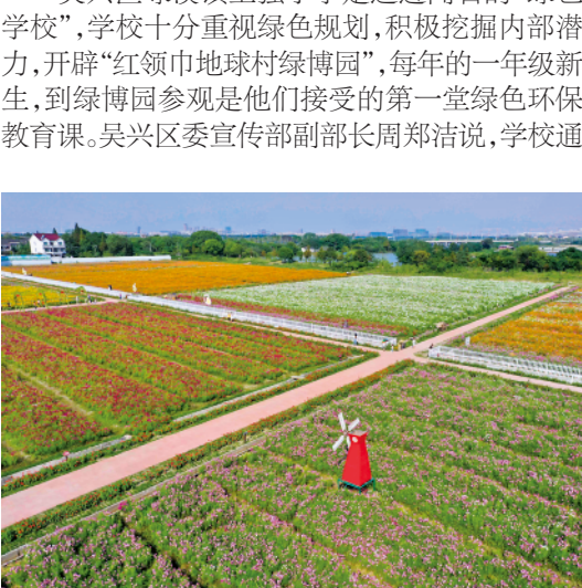
游客在湖州市吴兴区八里店镇移沿山生态景区的花海游览（2020年10月2日无人机摄）。