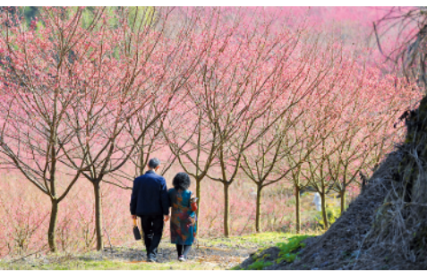
随着气温升高,在浙江杭州临安区米积村,竞相绽放的春花吸引众多村民和游客前来观赏。