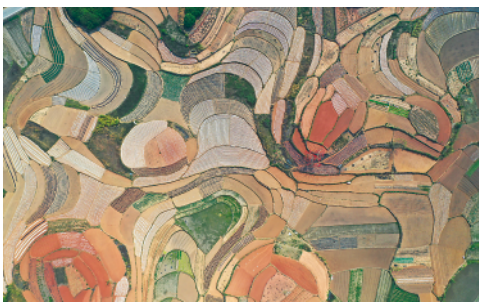
2月20日拍摄的南宁邕宁区蒲庙镇美丽的田园。春回大地,各地农民忙着春耕、春种,广袤田园生机盎然。