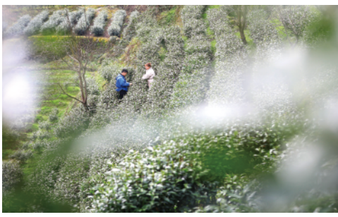
2月18日是雨水节气，湖南省湘西土家族苗族自治州吉首市马颈坳镇茶农在采摘春茶。