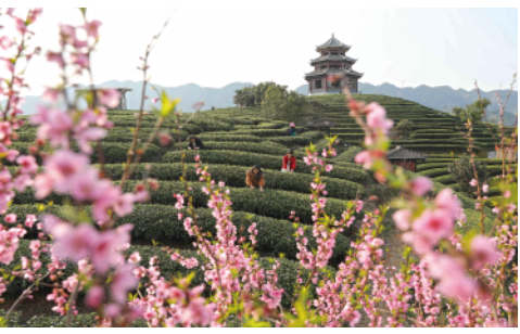
雨水时节，广西柳州三江侗族自治县茶园嫩芽勃发，当地茶农抢抓农时，赶采早春茶。