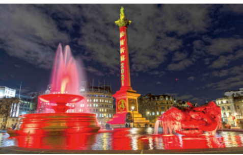
2月10日，英国伦敦特拉法加广场点亮“中国红”，庆祝中国农历新年“牛年”的到来。