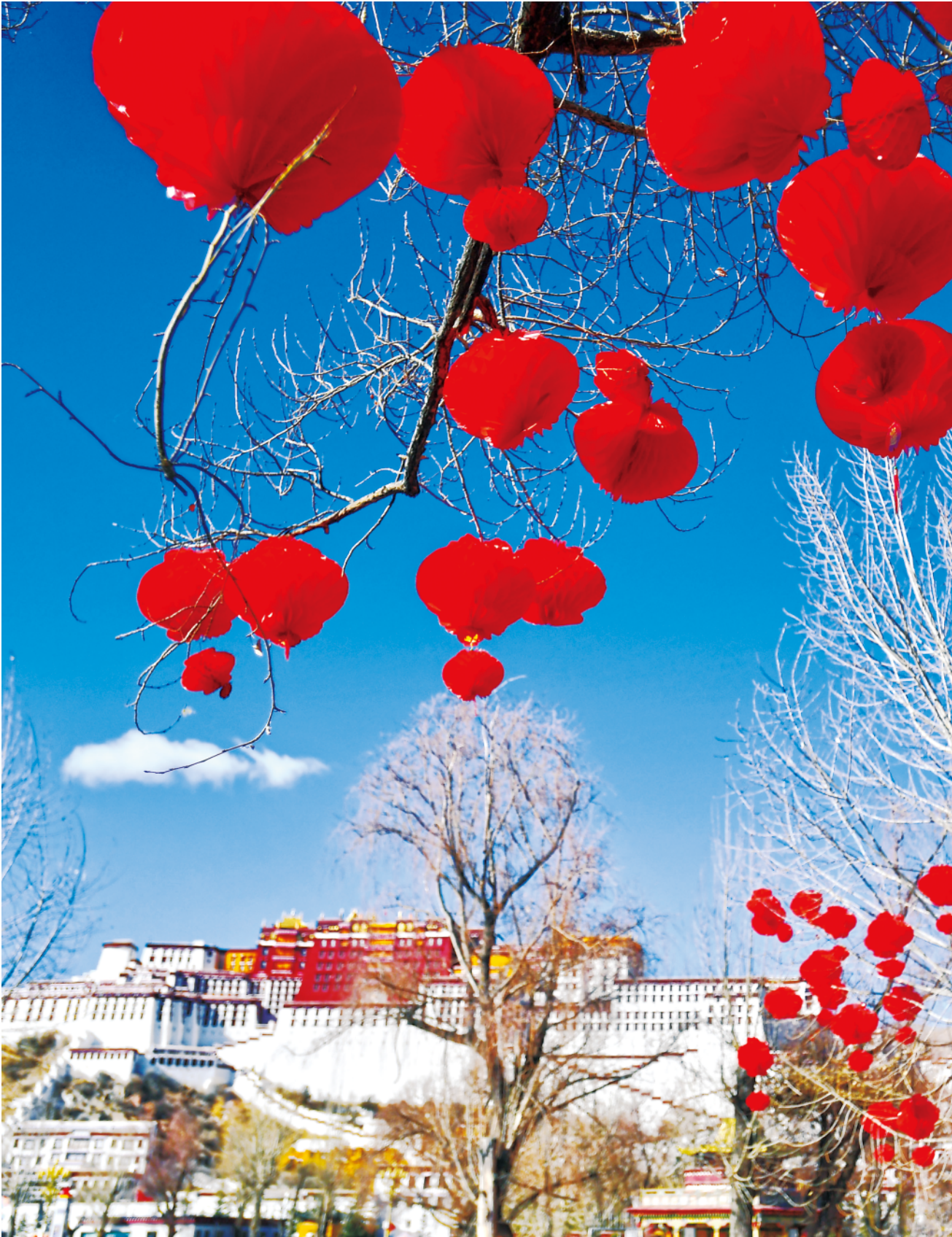
西藏各地群众迎来藏历铁牛新年和农历春节，这是拉萨布达拉宫前的红灯笼。