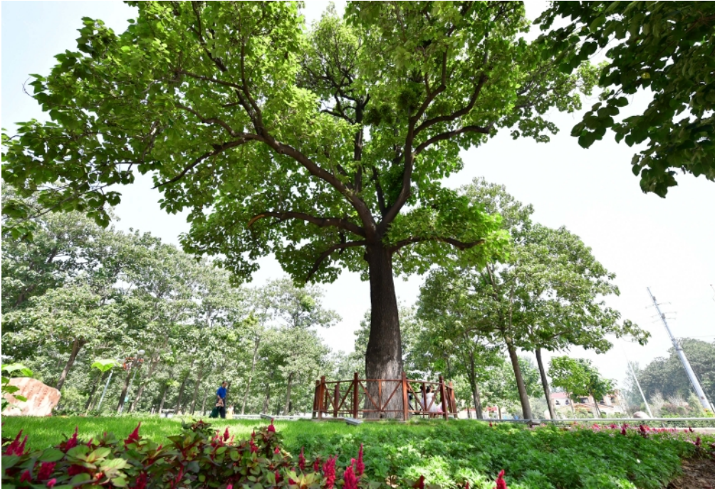
游客从兰考焦裕禄干部学院门口的“焦桐”下走过(2017年8月9日摄)。这棵泡桐是焦裕禄当年亲手种下，被人们称为“焦桐”。