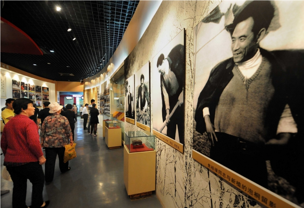
参观者在兰考焦裕禄纪念馆内观看焦裕禄事迹展览(2014年5月14日摄)。