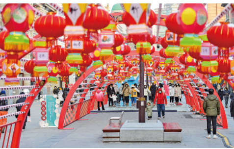
春节临近年味渐浓，在辽宁沈阳中街步行街，福牛艺术雕塑和各色花灯吸引了众多市民观看拍照。