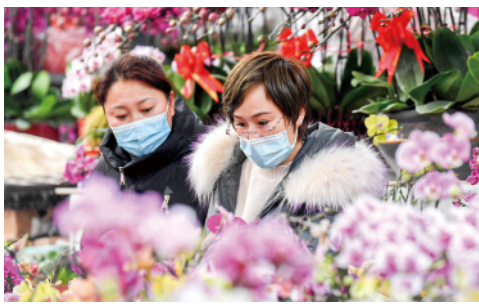
春节临近，石家庄市桥西区西三教花卉市场在做好疫情防控的同时，有序恢复市场经营，吸引市民前来选购。