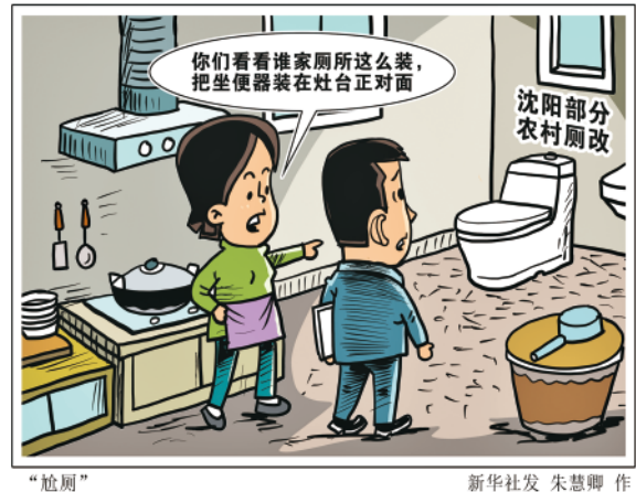
“尬厕” 新华社发 朱慧卿 作

建小厕所需要花大心思。落实推进“厕所革命”,绝不能欺上瞒下,更不能“忽悠”老百姓。只有搬开“绊脚石”,才能让惠民工程真正惠民。