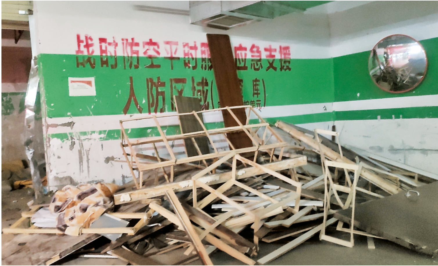
中部某地一小区标识有“人防区域”的地下停车位上,杂物堆积,墙体斑驳不堪。

人防部门调查人员表示,按照有关规定,人防工程未验收,开发商不能办理房产证。“令人诧异的是,不但房子在销售后办理了房产证,地下车位也以无产权方式销售多年。”这名调查人员说,因为属于未经验收的“人防工程”,他们对这一地下车库反而没有监管权。权属不明,收益争议。北京市盈科(南昌)