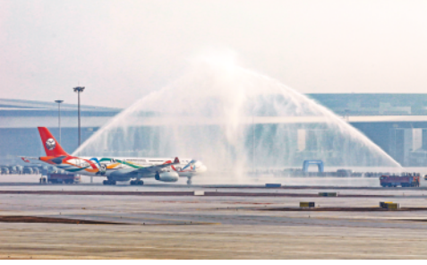
1月22日,“成都大运号”A330客机降落后通过“水门”。当日起,成都天府国际机场开始真机试飞。