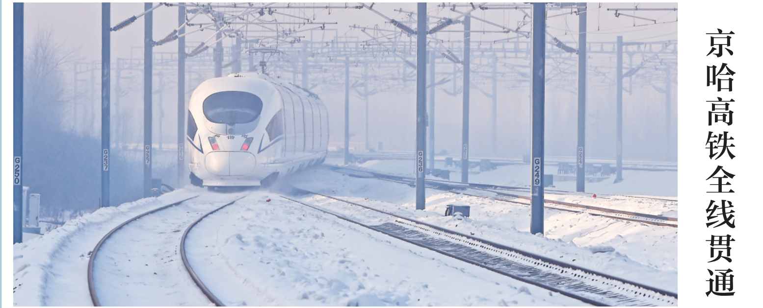
1月22日,京哈高铁G902次列车驶出哈尔滨西站。当日,北京至哈尔滨高速铁路实现全线贯通。哈尔滨至北京的高铁动车组列车最短运行时间将由目前的6小时32分压缩至4小时52分。

2020年初,北京冬奥会场馆设计难度最大、施工难度最高的国家雪车雪橇中心克服沟通不畅、时差颠倒等困难,在“战役”中与外籍专家远程连线推进建设,成为北京市春节期间唯一不停工的建设工程。(下转3版)