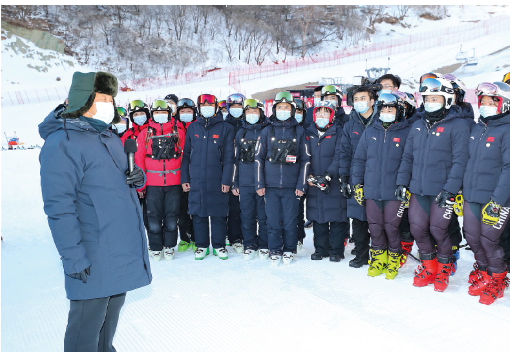
18日下午，习近平在位于北京市延庆区的国家高山滑雪中心，同赛场保障工作人员、运动员、教练员等亲切交流。