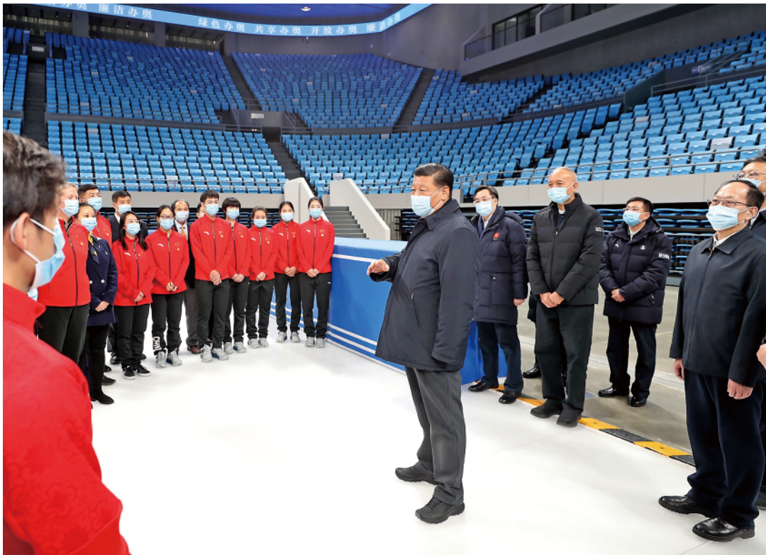
18日上午，习近平在位于北京市海淀区的首都体育馆，同国家花样滑冰队和短道速滑队运动员、教练员等亲切交流。