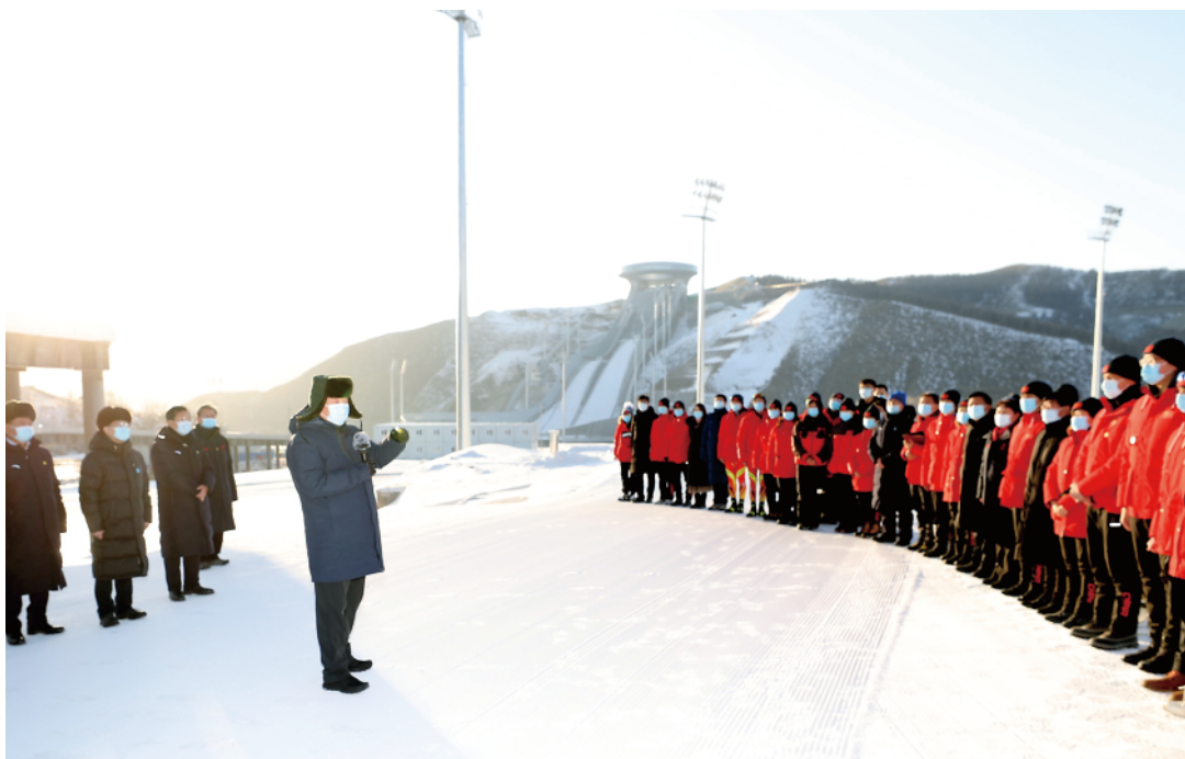
19日下午，习近平在位于张家口赛区的国家冬季两项中心，看望慰问国家冬季两项、跳台滑雪队运动员、教练员和张家口赛区运行保障团队、建设者代表。