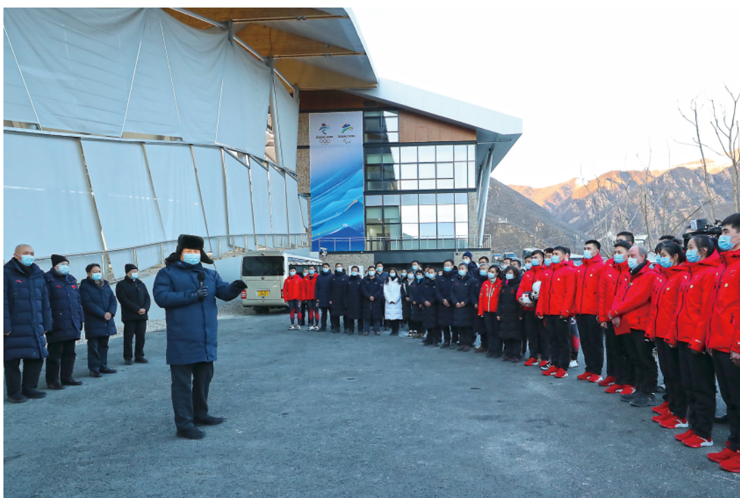
18日下午，习近平在位于北京市延庆区的国家雪车雪橇中心，看望慰问国家雪车、雪橇队运动员、教练员和延庆赛区运行保障团队、建设者代表。