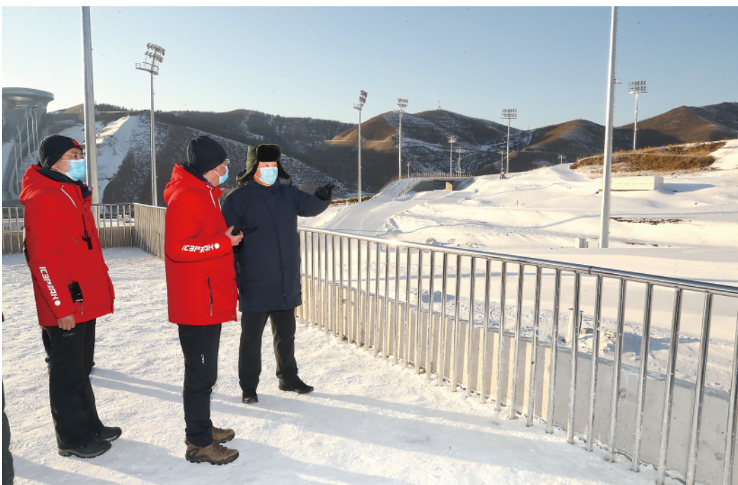
19日下午，习近平在张家口赛区国家冬季两项中心，了解冬季两项运动员训练情况。