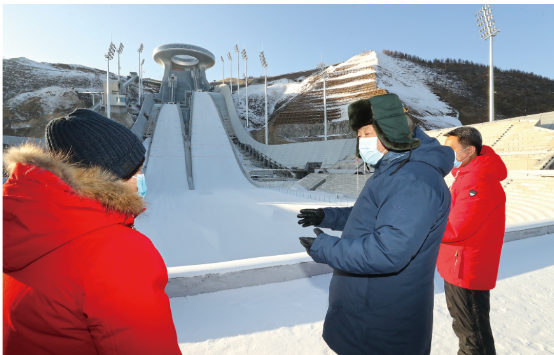
19日下午，习近平在张家口赛区国家跳台滑雪中心，察看跳台滑雪运动员训练演示。