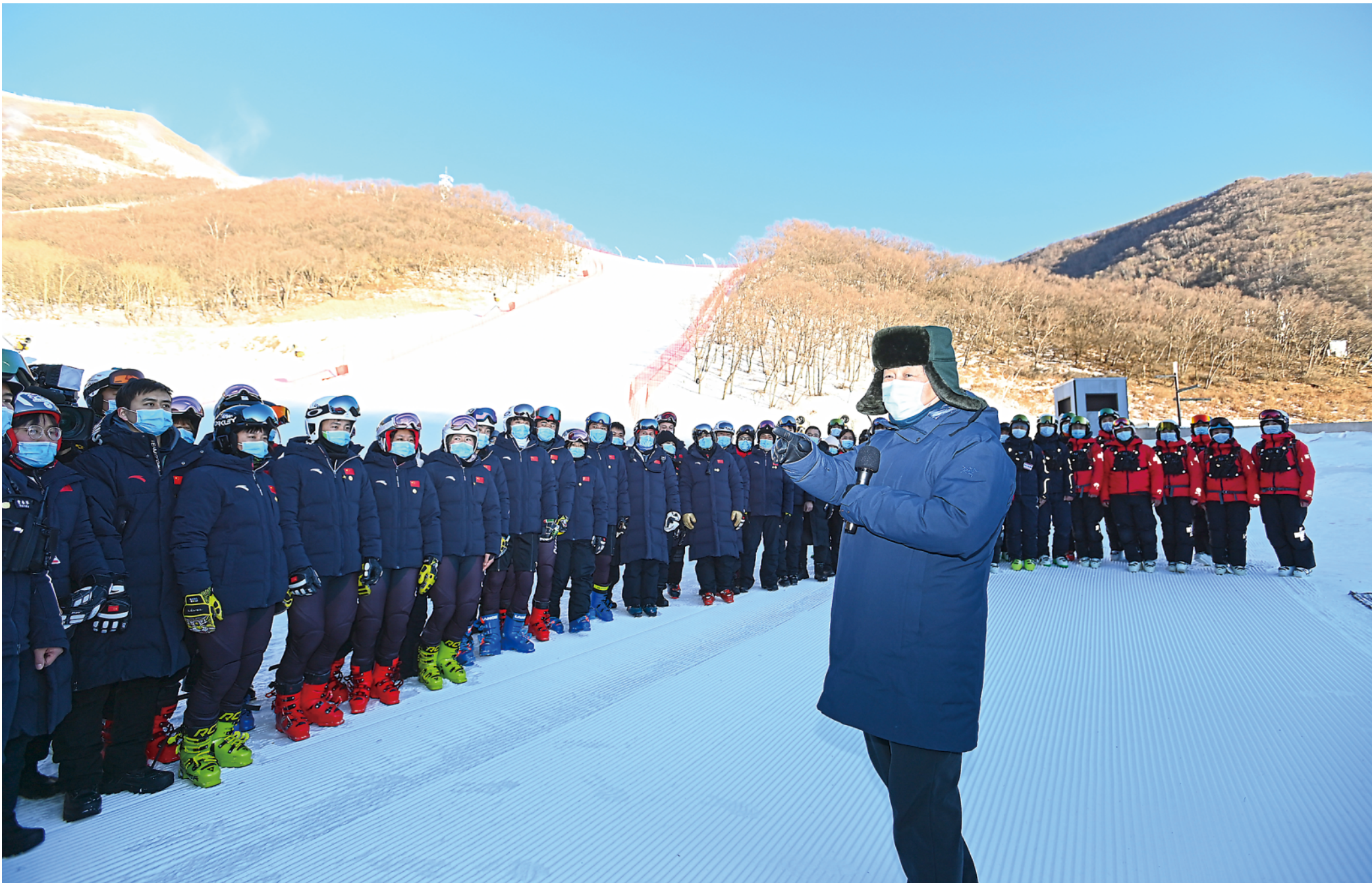
1月18日至20日,中共中央总书记、国家主席、中央军委主席习近平在北京、河北考察,并主持召开北京2022年冬奥会和冬残奥会筹办工作汇报会。这是18日下午,习近平在位于北京市延庆区的国家高山滑雪中心,同赛场保障工作人员、运动员、教练员等亲切交流。

新华社北京1月20日电中共中央总书记、国家主席、中央军委主席习近平近日在北京、河北考察,主持召开北京2022年冬奥会和冬残奥会筹办工作汇报会并发表重要讲话。他强调,办好北京冬奥会、冬残奥会是党和国家的一件大事,是我们对国际社会的庄严承诺,做好北京冬奥会、冬残奥会筹办工作使命光荣、意义重大。要坚定信心、奋发有为、精益求精、战胜困难,认真贯彻新发展理念,把绿色办奥、共享办奥、开放办奥、廉洁办奥贯穿筹办工作全过程,全力做好各项筹办工作,努力为世界奉献一届精彩、非凡、卓越的奥运盛会。 习近平向所有运动员、教练员,向所有参与北京冬奥会、冬残奥会筹办的建设者、管理者和工作人员致以崇高的敬意和衷心的感谢,向大家致以新春的美好祝福。 中共中央政治局常委、国务院副总理韩正出席汇报会。 隆冬时节,华北大地碧空如洗,山区银装素裹。1月18日至19日,习近平分别在中共中央政治局委员、北京市委书记蔡奇和市长陈吉宁,河北省委书记王东峰陪同下,冒着严寒先后来到海淀、延庆、张家口等地,深入体育场馆、训练基地、交通枢纽等,实地了解北京2022年冬奥会、冬残奥会筹办情况。 18日上午,习近平首先来到位于北京市海淀区的首都体育馆,听取北京冬奥会、冬残奥会筹办工作整体情况、参赛备战和群众性冰雪运动开展情况介绍,对各项筹办工作取得的进展表示肯定。 首都体育馆是国内第一座人工室内冰场,经过改扩建已具备冬奥会短道速滑和花样滑冰比赛训练条件。习近平走到训练场边,察看场馆改造情况,同国家花样滑冰队和短道速滑队运动员、教练员代表亲切交流。习近平指出,建设体育强国,是全面建设社会主义现代化国家的一个重要目标。体育强国的基础在于群众体育。要通过举办北京冬奥会、冬残奥会,推动我国冰雪运动跨越式发展,补短板、强弱项,逐步解决