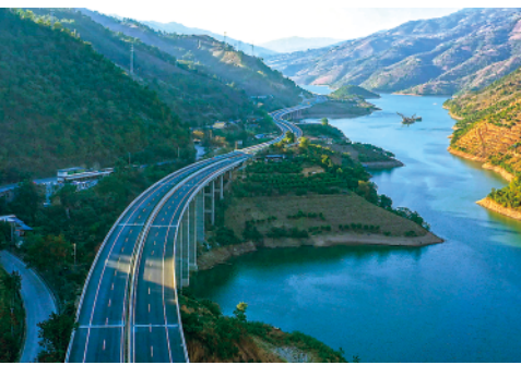
1月20日,云南普洱市思茅区至澜沧拉祜族自治县高速公路建成通车。