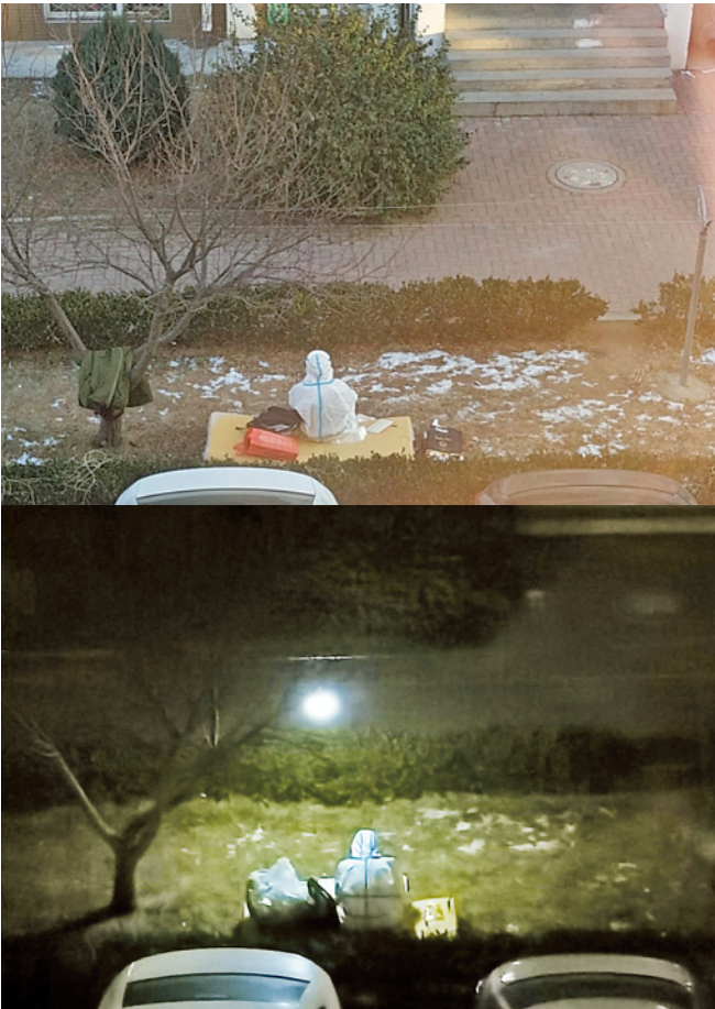
上图 为社区工作人员刘莹辉白天在封闭管理小区居民楼下露天“办公”(2020年12月20日摄);下图 为当天夜里,刘莹辉在同一地点继续工作。

1月6日下午,一张大连海洋大学师生顶风冒雪推车运送防疫物资的照片刷屏网络,湿润了众多网友的眼眶。19岁的大二学生李宗余就是这组照片中的主人公之一。 “我就是那个蹬车少年。”在电话另一头,李宗余笑着跟记者说,“我从小在农村长大,帮家里干活的时候学会了骑电动车。” “蹬车少年”上任始于2020年12月22日。为防控疫情,大连海洋大学封闭校园,17名平均年龄19岁的学生组成了青年抗疫突击队,承担起每日运送物资的任务。 “那天雪太大了,蹬车可费劲了。”李宗余说,就是那天,突击队连推带拉分3次运送了整整28箱防疫物资,该送的一箱也没有落。 李宗余在前面蹬,后面还有10多个人在推。带队老师王海鹏就是其中一个。 “当时雪真大,我们穿着防护服、戴着