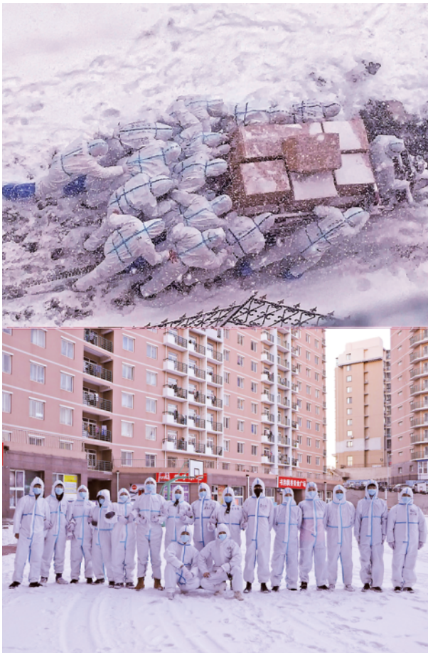
上图 为1月6日,大连海洋大学师生顶风冒雪推车运送防疫物资;下图 为当日,在风雪中运送物资的大连海洋大学师生在工作结束后合影。

数九寒冬,战疫正紧。一张张令人泪目的照片在网上刷屏,暖化了无数人的心。记者选取其中三张照片,找寻照片的主人公,讲述照片背后的感人故事。