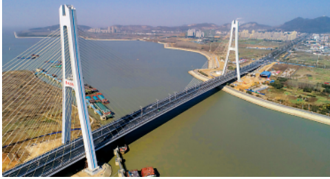
1月12日,安徽巢湖大桥建成通车。巢湖大桥于2018年1月12日正式开工建设,是环巢湖大道贯通的重要节点工程之一。