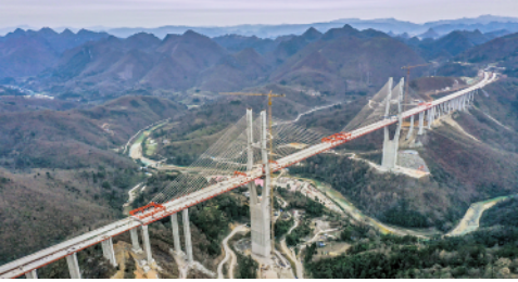
目前,贵州都(匀)安(顺)高速公路云雾大桥工程建设进展顺利。云雾大桥位于贵州贵定县境内,是都安高速公路控制性工程(1月10日摄)。