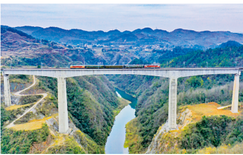
1月9日，瓮马铁路正式进入动态验收阶段。瓮马铁路全长约72公里，是贵州省首条自建自营地方铁路。