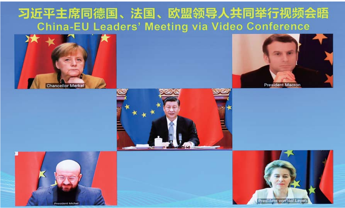
▲12月30日晚，国家主席习近平在北京同德国总理默克尔、法国总统马克龙、欧洲理事会主席米歇尔、欧盟委员会主席冯德莱恩举行视频会晤。中欧领导人共同宣布如期完成中欧投资协定谈判。