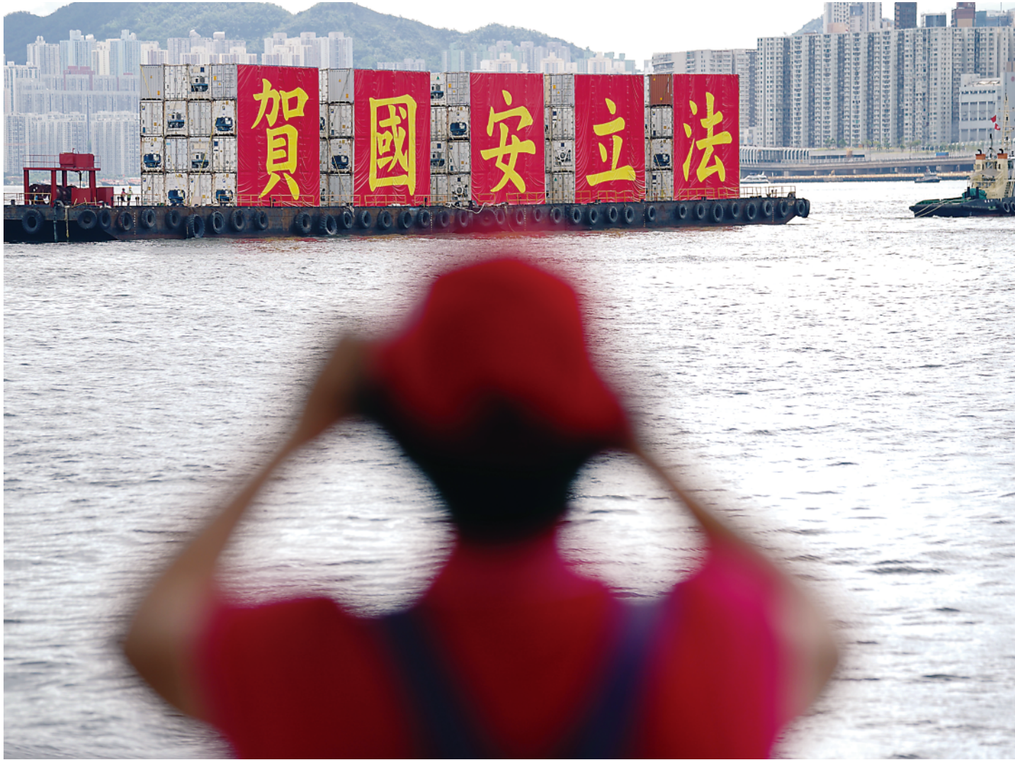
▲ 写有“贺国安立法”的渔船在香港维多利亚港巡游（7 月 1 日摄）。

“去年 6 月以来，一到周末或节假日就游行示威不断。位于暴乱重灾区铜锣湾和旺角的店铺，通常只能营业几个钟头就不得不关门避祸，搞得店员和行人个个惶恐不安。”香港零售及批发从业员协会理事长蔡宗建说，